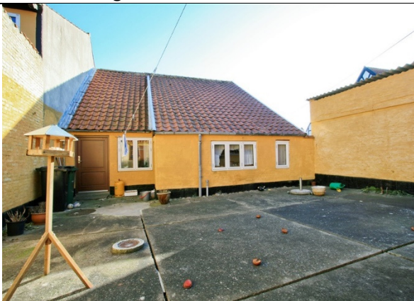
Gårdhaven set mod beboelsen