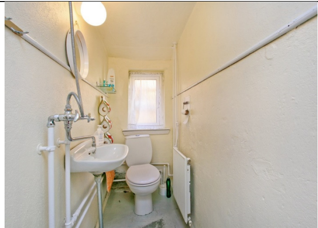
Toilet/badeværelse med brus.