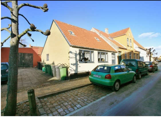
Byhuset set fra gaden