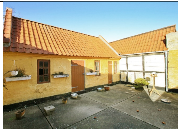
Gårdhaven set mod baghuset