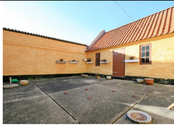
Solrig gårdhave med baghuset