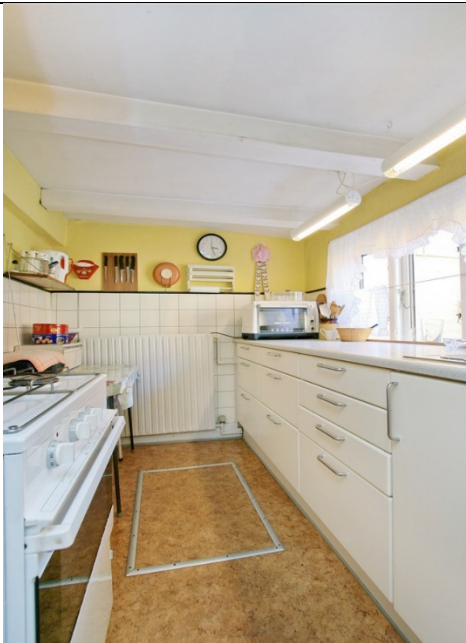
Køkkenet mod gårdhaven